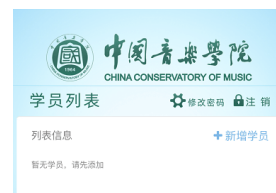
图 5 按设置的密码首次登陆