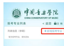
图 8 学员新增报名信息