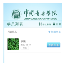
图 7 学员列表